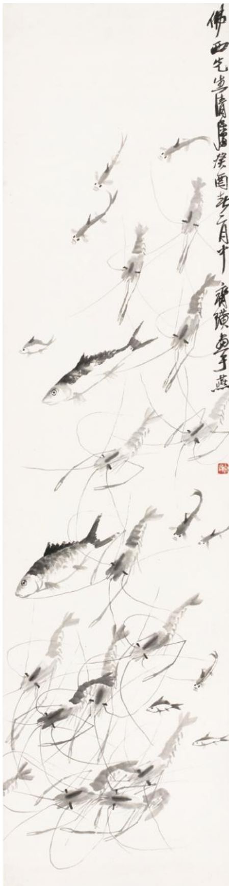
Ryby a krevety od Qi Baishiho

„Je zde stále veliký rozdíl mezi východem a západem v pochopení, zda zvednutí čísla na aukci je vlastně závazná smlouva nebo ne,“ řekl Philip Tinari, ředitel Ullensova Centra pro Současné umění v Peking. „Někteří mladíci nakoupí na aukci kupu obrazů, vyjdou ven a řeknou, ‘Číslo 13, 11, 7, 6, 5 jsou ta, co nechci.’ To se stává pořád.“