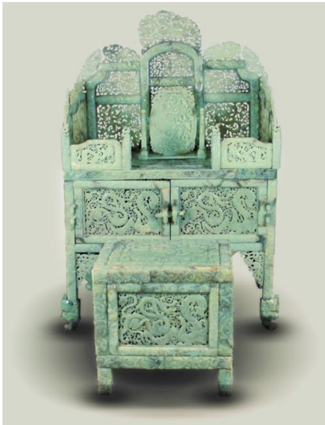
Zdobení jadeitový toaletní stůl a stolička prodané v roce 2011 jako starožitnost z období dynastie Han. Později bylo prokázáno, že byly vyrobeny pouze o rok dříve.

Stolička a toaletní stůl byla souprava, vytesaná z jadeitu, představovaná jako starožitnost z dynastie Han, datovaná do doby před 2000 lety. Její prodejní cena se na aukci v roce 2011 v Pekingu vyšplhala na 33 milionů dolarů a vyvolala rozruch. Pak ale experti začali poukazovat na to, že v době dynastie Han (206 př.n.l. – 220 n.l.) Číňani na židlích neseděli, ale seděli na zemi. Nakonec lídr jadeitového obchodu z Pizhou, provincie Jiangsu ve východní Číně, potvrdil, že tyto kusy tam byly řemeslníky vyrobeny v roce 2010.