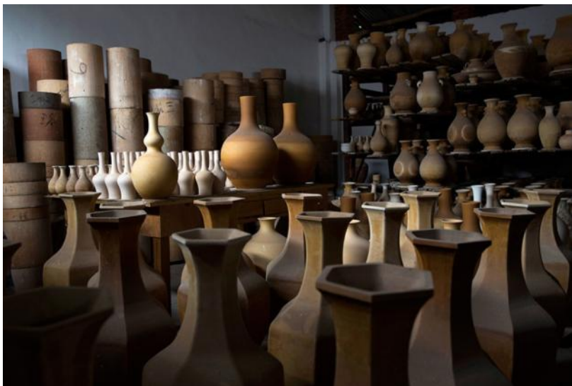
Keramické vázy a džbány se suší než se vypalují v pecích továrny Xiong Jianjun, jedné z nejznámějších čínských výrobců reprodukcí v Jingdezhen, starobylém centru výroby porcelánu. Adam Dean.

Vlastně jen několik málo oblastí obchodu nabízí tak odhalující pohled na tuto socialistickou společnost vrávoraající směrem ke kapitalismu jako je trh s uměním. Jako mnoho luxusních podniků v Číně, exploze kupců shánějících se po umění byla poháněna zadržovaným konzumem těch nově zbohatlých. Poptávka je tak obrovská, že minulý rok země, která sotva měla trh s uměním dvacet let nazpět, hlásí 900% nárůst zisku z aukcí oproti roku 2003 – na 8,9 miliardy dolarů. V USA to v roce bylo 8,1 miliardy dolarů.