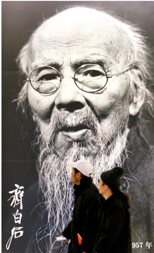
Qi Baishi, často imitovaný moderní mistr tradičních čínských maleb, který zemřel v roce 1957.