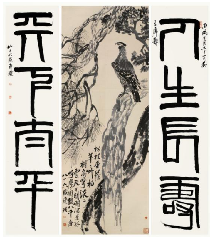
„Orel stojící na borovici“, zdroj Agence France-Presse, další obrázky od Artron.

Ale dva roky po aukci mistrovské dílo Qi Baishi stále zůstává v pekingském skladu. Vítězný dražitel odmítl zaplatit, jelikož vyvstaly pochybnosti o pravosti díla.